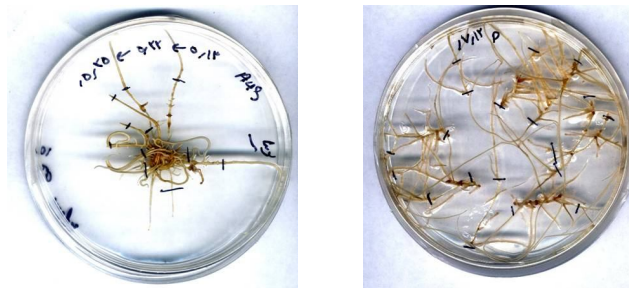
شکل 2- ریشه‌های القایی بر روی محیط MS حاوی آنتی بیوتیک سفوناکسیم

نتایج نشان داد که در 40 پلیت از 50 پلیت که از گونه G. intraradices به عنوان قارچ همزیست استفاده شده بود، رابطه همزیستی برقرار شده و قارچ قسمت عمده‌ای از حجم پلیت را با گسترده کردن هیف‌های خود و تولید اسپور اشغال کرده بود.