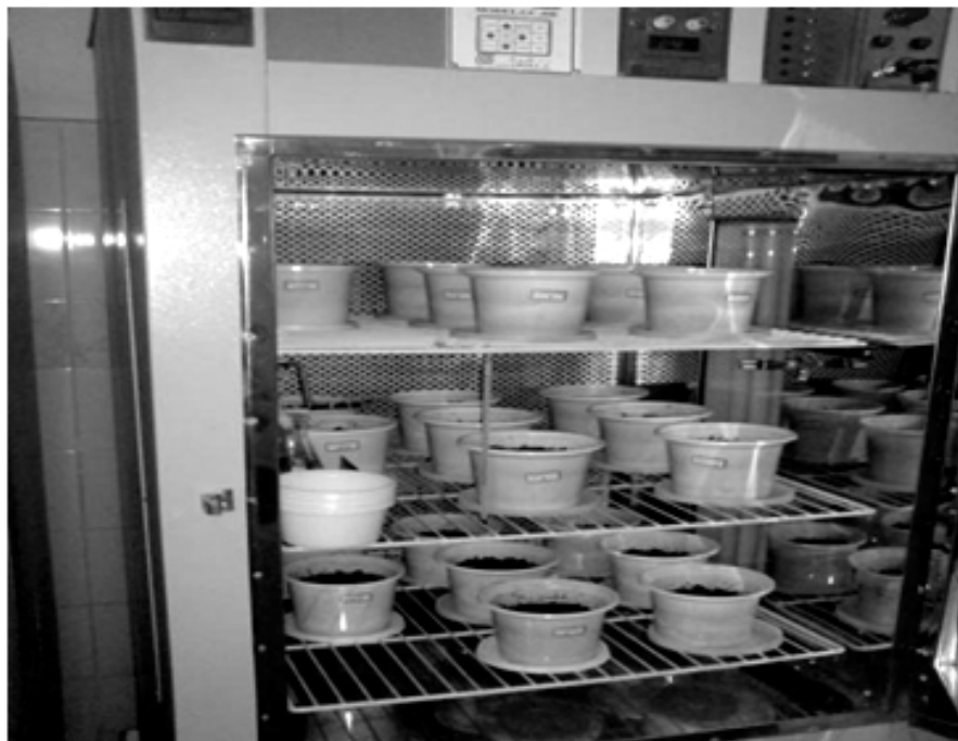
شکل 1- نگهداری تیمارها در شرایط رطوبی و دمایی ثابت و فضای تاریک